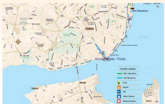
8,5 KM MINI MARATHON