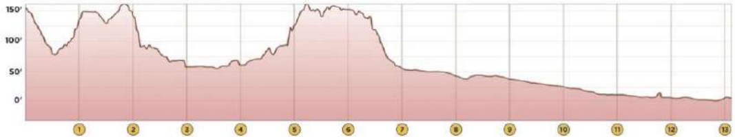
ELEVATION CHART (NOT TO SCALE)